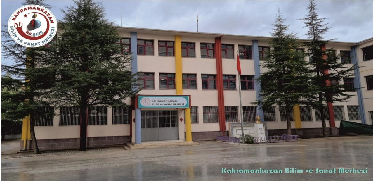
Kahramankazan Bilim ve Sanat Merkezi

Kahramankazan Bilim ve Sanat Merkezi 28.10.2021 tarihinde resmi olarak açılmış olup 2022-2023 Eğitim-Öğretim yılında 33 öğrenci ile faaliyete geçmiştir. Merkezimiz Kahramankazan, Kızılcahamam ce Çamlıdere ilçelerinden öğrenci almaktadır. Merkezimizde, 1 Fen Laboratuvarı ve 9 atölyemiz bulunmaktadır. Merkezimiz çocuklarda bilim, teknoloji, matematik, mühendislik ve sanat gibi alanlardaki temel becerilerini geliştirmelerine yardımcı ve çocukların meraklarını beslemede ailelere destek olan yaratıcı öğrenme ortamları sunmaktadır. Ayrıca tüm etkinliklerde çocuklar ilgi, yetenek, ihtiyaç gibi çeşitli bireysel farklılıklarına göre yönlendirilmektedir.